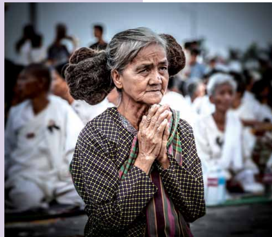
Phnom Penh, Camboya. Decenas de miles de personas provenientes de todo el país se acercaron a la capital, Phnom Penh, durante los funerales del Rey de Camboya para rezar por su alma, muchas de ellas de avanzada edad.

Lonely Planet, Esquire Malaysia, Business Destinations, The Epoch Times, Pacific Magazines... la lista es larga.