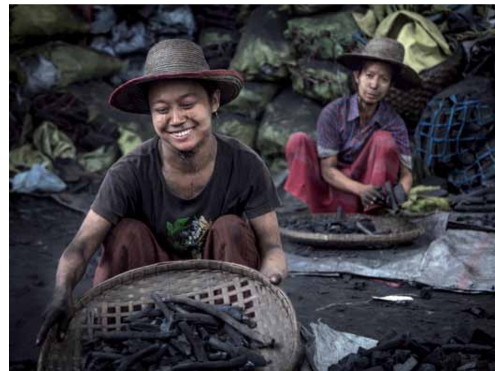
Amarapura, Myanmar. Mujeres carboneras recogen el mineral que llega en tren hasta Amarapura, antigua capital de Birmania. Lo separan por tamaño y lo empaquetan en sacos de rafia que luego son vendidos a la población local.

Las imágenes de Sergio Díaz han sido publicadas en medios como National Geographic , El Mundo ,