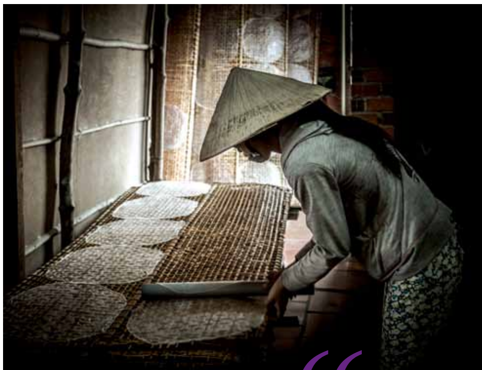
Delta del Mekong, Vietnam. Trabajadora de una fábrica artesana de pasta con la que se fabrican los famosos noodles que, junto con el arroz y los vegetales, son la base alimenticia de millones de personas en Asia.

“Las mujeres desempeñan un papel crucial en el mantenimiento de la economía familiar”