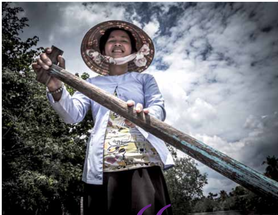
Delta del Mekong, Vietnam. Las barqueras son muy típicas en el delta del Mekong. Por pocos dólares y con una gran sonrisa recorren con los turistas los principales puntos de interés.

“ Los valores familiares, la estabilidad económica, la salud... estas cosas son comunes en cualquier lugar del mundo ”