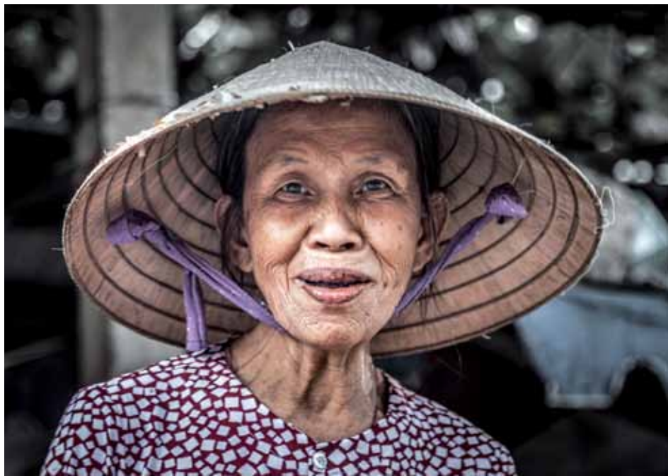
Hoi An, Vietnam. En los alrededores de la ciudad de Hoi An existen pequeñas aldeas eminentemente agrícolas y en sus mercados siempre encontraremos a alguna vendedora dispuesta a regalarnos la mejor de sus sonrisas.

Desde luego. Aprendes mucho cuando convives con personas cuyos valores son tan distintos a los nuestros. En mi caso, he vuelto mucho más espiritual de lo que era cuando me fui y, aunque parezca un tópico, he aprendido que los bienes materiales no son necesarios para alcanzar la felicidad. Yo he sido tremendamente feliz cuando todas mis pertenencias cabían en una mochila.