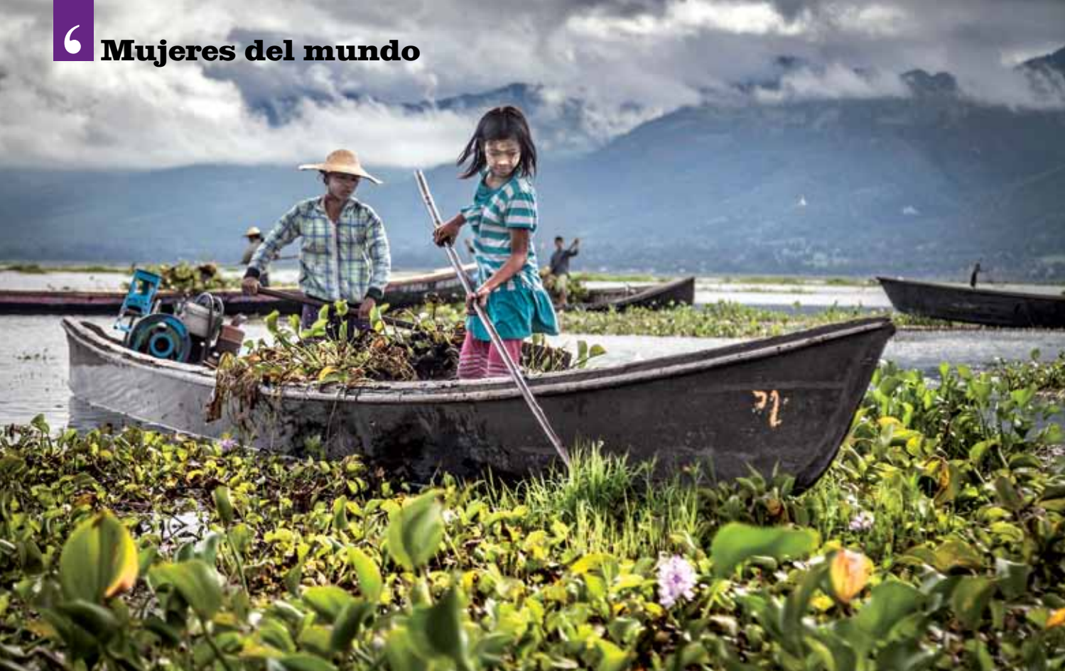
Lago Inle, Myanmar. En los alrededores del lago Inle existen más de 200 poblaciones dedicadas fundamentalmente a la pesca y al cultivo sobre el agua, gracias a una técnica llamada hidroponía. Es uno de los pocos lugares del mundo donde esta técnica se utiliza a gran escala. En las tareas de recolección participa toda la familia.