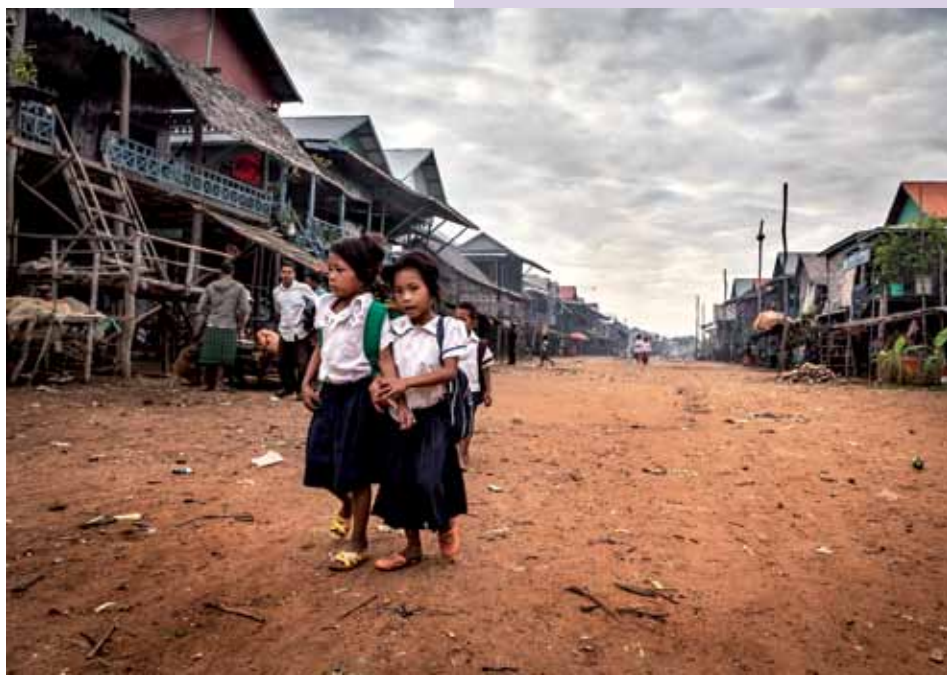
Kompong Phluk, Camboya. A tan solo 40 kilómetros de los afamados templos de Angkor podemos encontrar aldeas tremendamente pobres, como Kompong Phluk. Sin embargo, todos los niños acuden uniformados a la escuela.

Cuando se trata de traer dinero a casa todo el mundo colabora y las mujeres desempeñan un papel crucial en el mantenimiento de la economía familiar. Como en el resto del mundo, además de en las tareas del hogar, vemos a las mujeres desarrollando labores agrícolas, en comercios, mercados, etc. También es bastante común