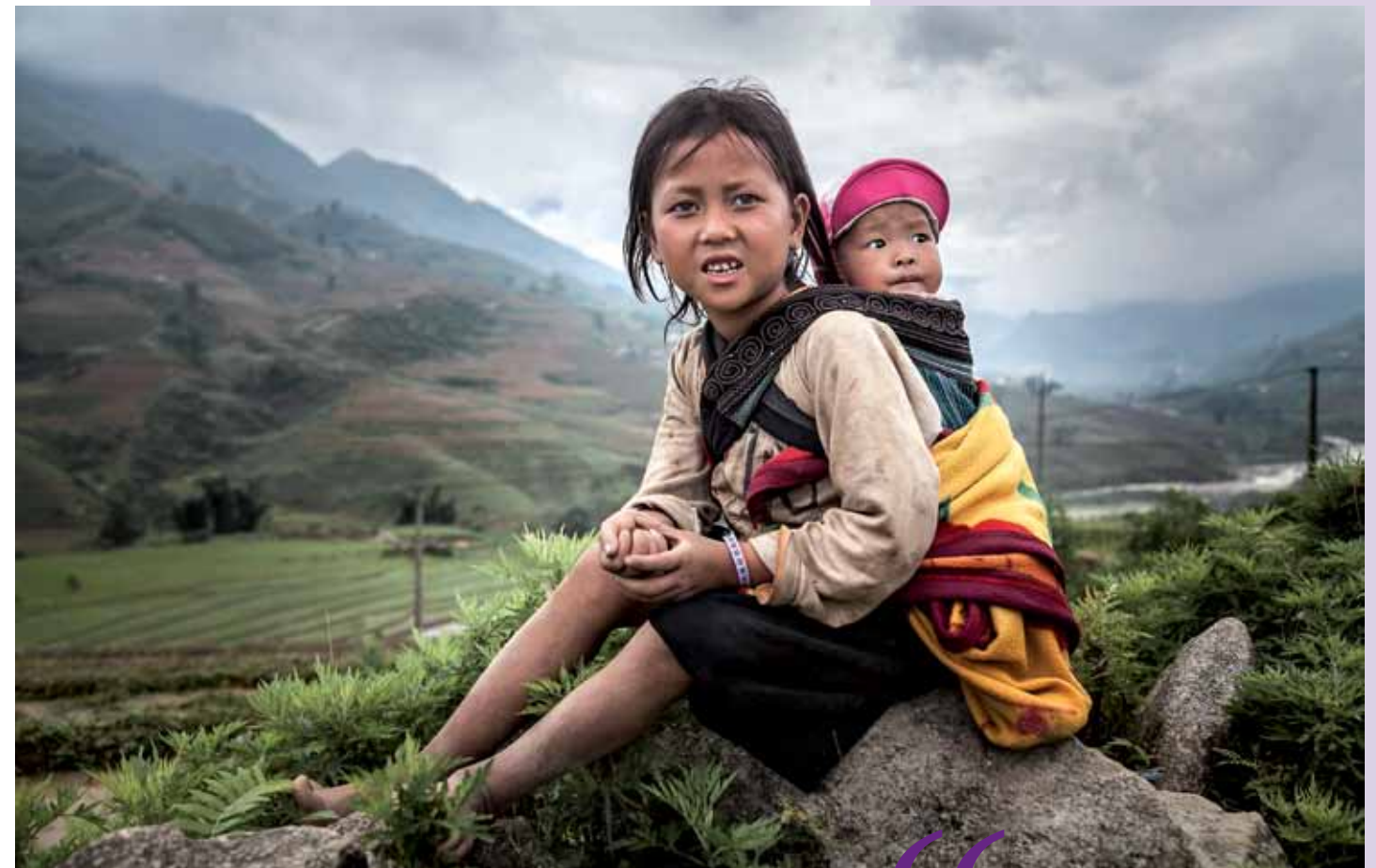
SaPa, Vietnam Las hermanas mayores juegan un papel fundamental en el cuidado de los menores mientras los padres se dedican a las tareas agrícolas en el valle de SaPa.

“ Los valores familiares, la estabilidad económica, la salud... estas cosas son comunes en cualquier lugar del mundo ”